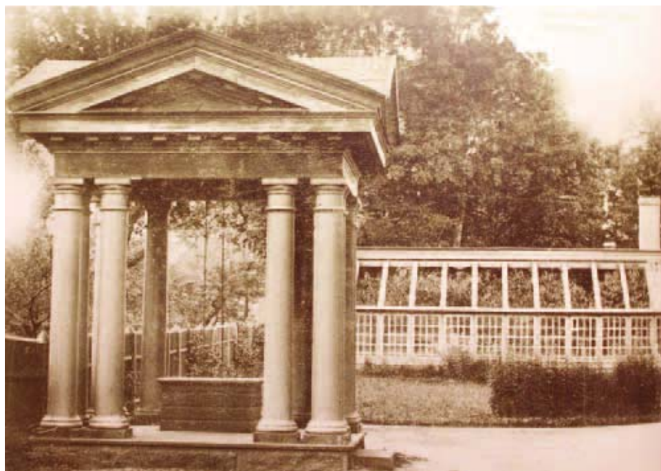
Pagari mõisa kaevupaviljon on kaunistatud eriti suursuguse sammastikuga. Taamal paistab triiphoone.