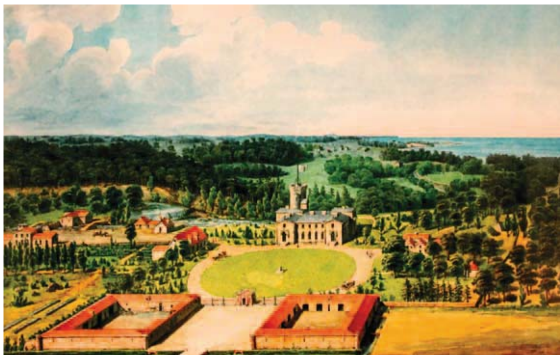
Keila-Joa mõisa üldvaade. Väikest esiväljakut raamivad tall ja karjahoov, mis on romantiliste detailide rõhutamiseks ümbritsetud omakorda „kaitsekraaviga“. Lossi ees olevat väljakut ümbritsevad külalistemaja ning nn kirikumaja. Andrei Stackenschneideri akvarell.

Eri ajajärkudel valminud mõisakompleksid on väga erineva hoonestusega, mis on enamasti aja jooksul pidevalt täienenud. Kesksel kohal on mõisa peahoone. Paljudes mõisates suundub pikk sihttee, mis on valdavalt kujundatud muljetavaldava alleena, otse häärberi peaukse ette. Mõnikord läbib see kujutletav telg peahoone, kulgeb läbi peaukse vastas asuva tagaukse ja jätkub pargis teena, mille lõpus terendab mõni skulptuur või paviljon. Vaid üksikutel juhtudel kulgeb tee peahoonega paralleelselt, kuid ka siis on sellel oma kindel seotus. Harjumaal Kolga mõisas näiteks läbitakse mõisakompleksi sisenedes vahimajakestest kujundatud auväravad, liigutakse piki peahoone esifassaadi ning jõutakse sihttee lõpus paistva karjakastelli esisele ristteele.