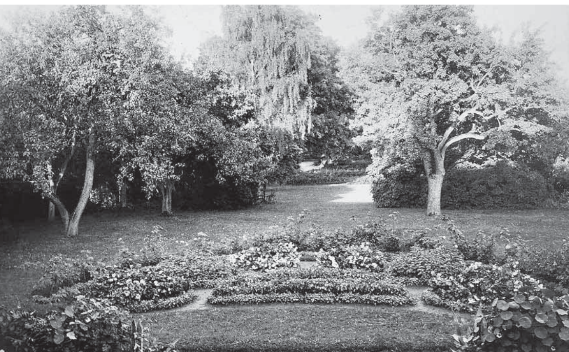
Vaade Putkaste mõisa aeda.

prantsuse park pidi demonstreerima inimese võimu looduse üle, siis nüüd moodi tulnud inglise ehk pime park soosis kõike looduslikku. Tõsi küll, park oli kujundatud, kuid nii, et esmapilgul seda ei märganudki. Maalilised looklevad rajakesed põlispuude vahel, väikesed välud vaheldumas puudesaludega ning nende rüppe peitunud ojake või tiigisilm löid just õige mulje. Park pidi olema koht, kus end hästi tunda ja nagu Jumala rajatud Eedeni aias tajuda end osakesena loodusest. 18. sajandi teisel poolel jõudis see mood ka Eestisse.