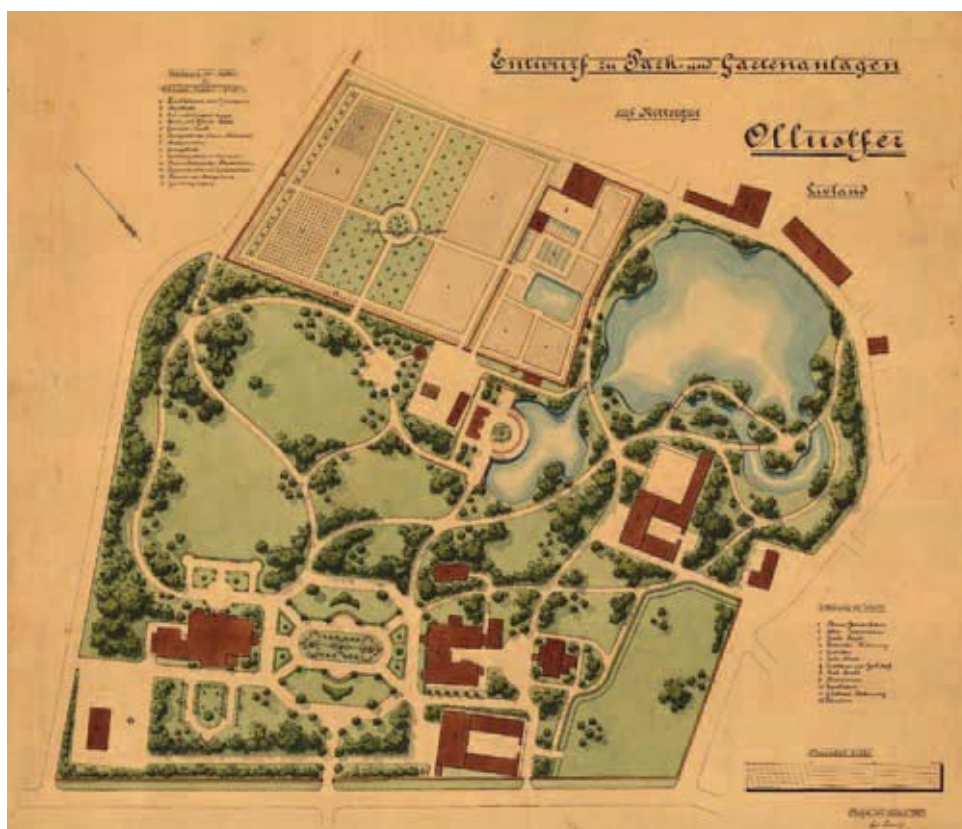
Olustvere mõisasüidame plaan.

Sellise klassikalise asetusega on näiteks Harku mõisasüida. Hooned olid välise arhitektuuri osas tavaliselt sarnased ning ühtmoodi varustatud sammaste ja kaaristutega. Auringi piiravaid hooneid ei pidanud olema tingimata kaks, vaid võis olla ka neli või kuus, aga kindlasti pidi neid üldise sümmeetria saavutamiseks olema paarisarv. Vaid harvadel juhtudel lahendati olukord teisiti. Näiteks Läänemaal Võnnu mõisas seisavad auringi külgedel tall-tõllakuur ja ait ning peahoone vastas teenijatemaja. 8