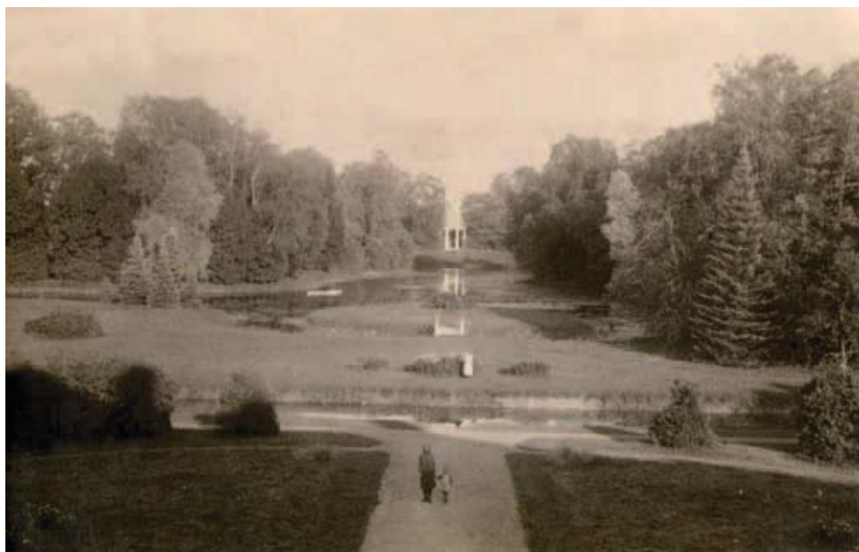
Vaade Aaspere mõisa parki. Üle tiigi paistab pargipaviljon.

Regulaarsus ei saanud aga igavesti kesta. 18. sajandil tehti kannapööre. Kui