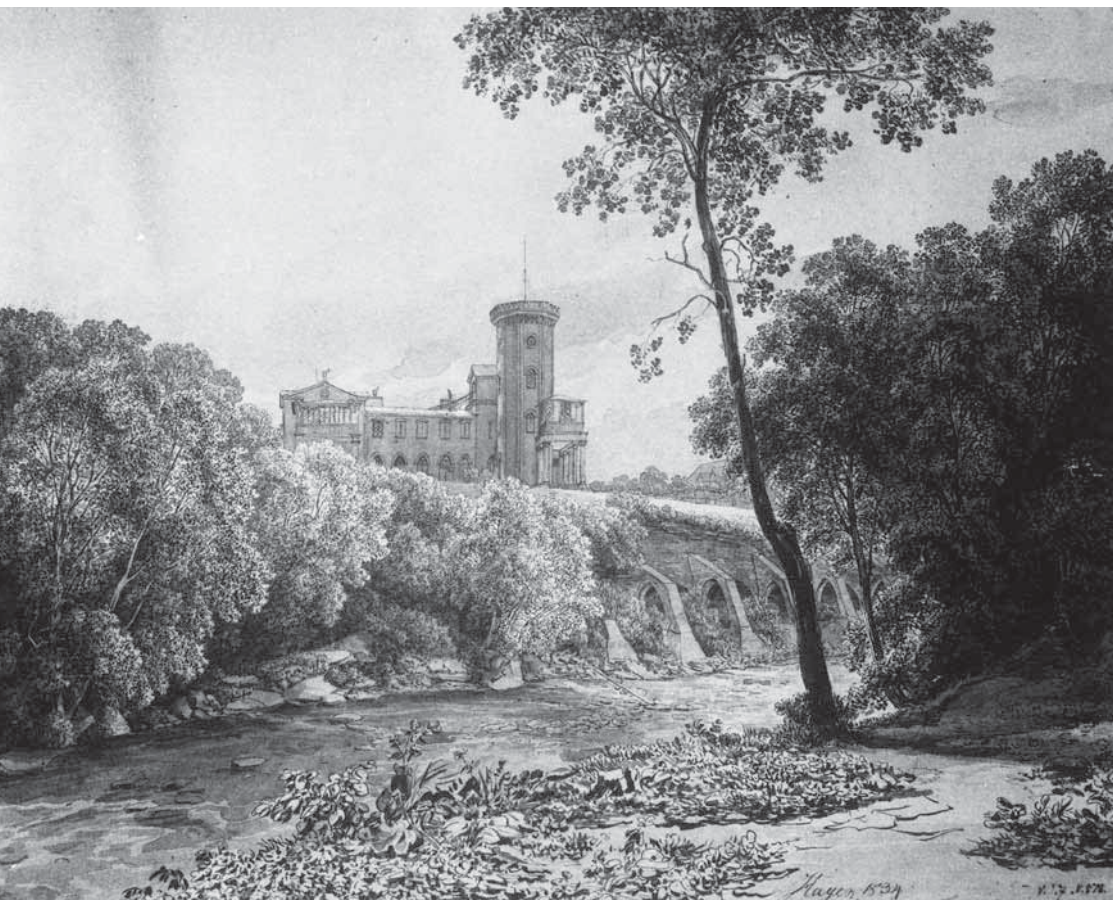
Keila-Joa mõisakompleks on rajatud Keila jõe kaldale. August Matthias Hageni gravüür.