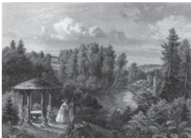
Vaade Heimtali mõisapargi tiigile ning paviljonile ja juustuköögile. Peahoone on rajatud oru kõrgele kaldale. Stavenhageni gravüür.

paikadesse, kus jõed ja ojad olid olemas. Tiikidesse rajati saari ning kaldale ehitati paadimajakesi, et silmal oleks ilus vaadata ja paadiga saaks romantilisele retkele suunduda. Erilise õnnega olid koos need mõisad, kus leidus looduslik järv – näiteks Klooga ja Kuremäe, väike klindijärveke on ka Harkus. Mitme mõisa parki ehtisid purskkaevud, mõned neist lihtsamad (Tilsis, Väänas ja Kabalas), mõned aga keerukama skulptuurigrupiga (Sangastes). Kahjuks pole ükski neist tervena säilinud.