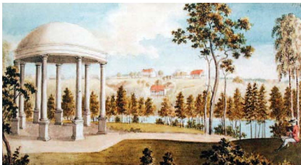
Vaade Polli mõisale Templimäelt. Esiplaanil tempel-paviljon, teisel pool Kutsiku oja orgu mõisa hooned. Templimäe paviljon ehitati hiljem ümber ning seda hakati kutsuma tähetempliks. Praeguseks on tempel hävinud, nagu ka pargis paiknenud puidust paviljon ehk nn sääsekirik. Brotze kogu.