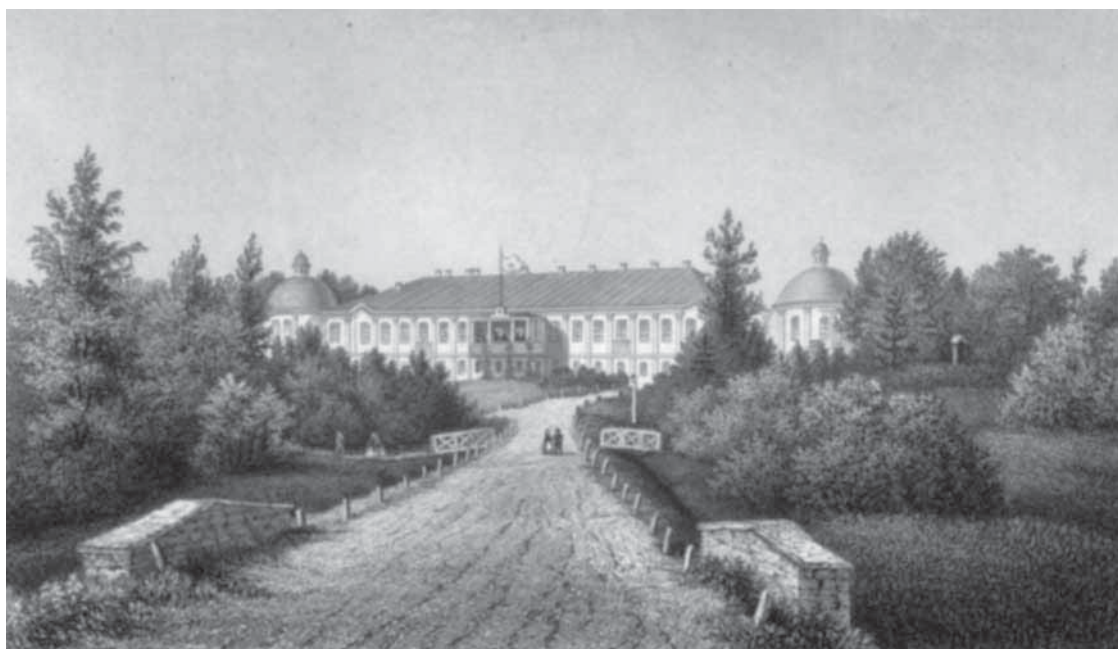
Vääna mõisa peatee, keskel historitsistlikus stiilis peahoone tagafassaad. Hoonet iseloomustavad otstel paiknevad ümara põhiplaaniga torn-paviljonid. Stavenhageni gravüür.