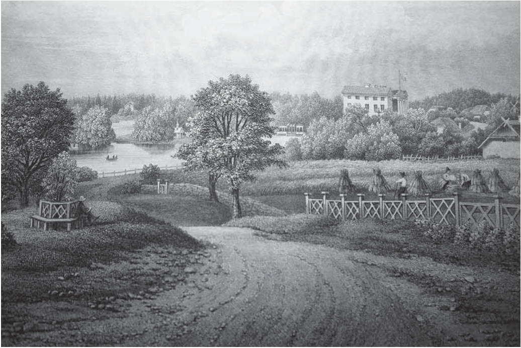
Riisipere mõis. Sammastikuga peahoone taga asuva järve saarekesel on näha paviljon. Stavenhageni gravüür.

Kui 17.–18. sajandil üldine julgeolekuolukord paranes, sai rohkem keskenduda esteetilisele küljele. Siiski jäid igapäevaelus olulised hooned – ait, tall ja tõllakuur – mõisa peahoone vahetusse lähedusse. Viimased kaks liideti tavaliselt üheks – tall-tõllakuuriks.