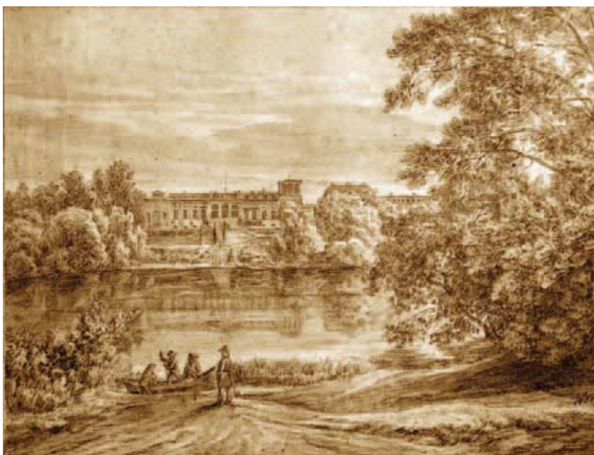
Raadi mõisa peahoone enne ümberehitusi 19. sajandi lõpus.