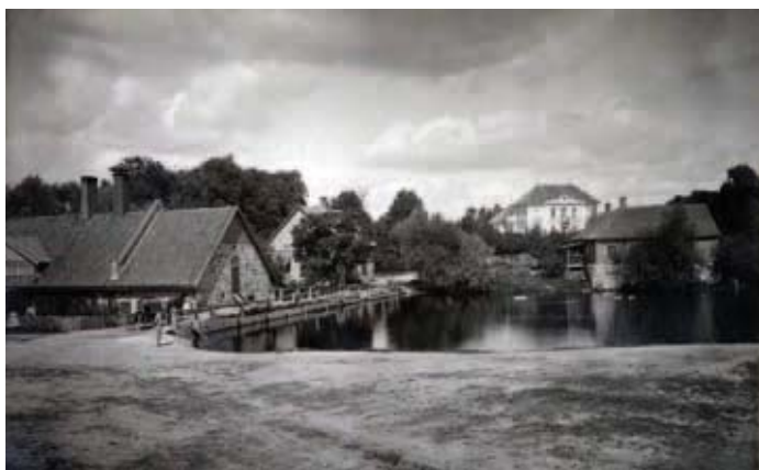
Vana-Nursi mõisa- hooned, taamal peahoone.

Kui jõgi või oja puudus, tuli leppida tiikidega. Tegelikult paisutati neid ka