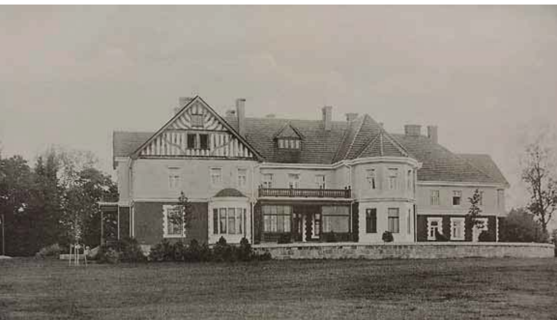
Olustvere mõisa uus härrastemaja 1909. aastal.

1668. aastal pantis Jakob De la Gardie poeg Pontus Friedrich mõisa Pornuse mõisa omanikule maanõunik Johann von Schlippenbachile. 1680. aastal mõis riigistati, kuid jäi endisele omanikule rendile. 1694. aastal päris rendiõiguse Johann von