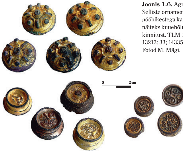
Joonis 1.6. Agraffnööbid Proosa kalmest. Selliste ornamenditud ja sageli kullatud nõobikestega kaunistasid 5.–6. sajandi ülikud näiteks kuuehõlma nurki ja kaelust või vöökinnitust. TLM 15109: 15, 21, 27; 13943: 90; 13213: 33; 14335: 33; 14847: 8, 77.