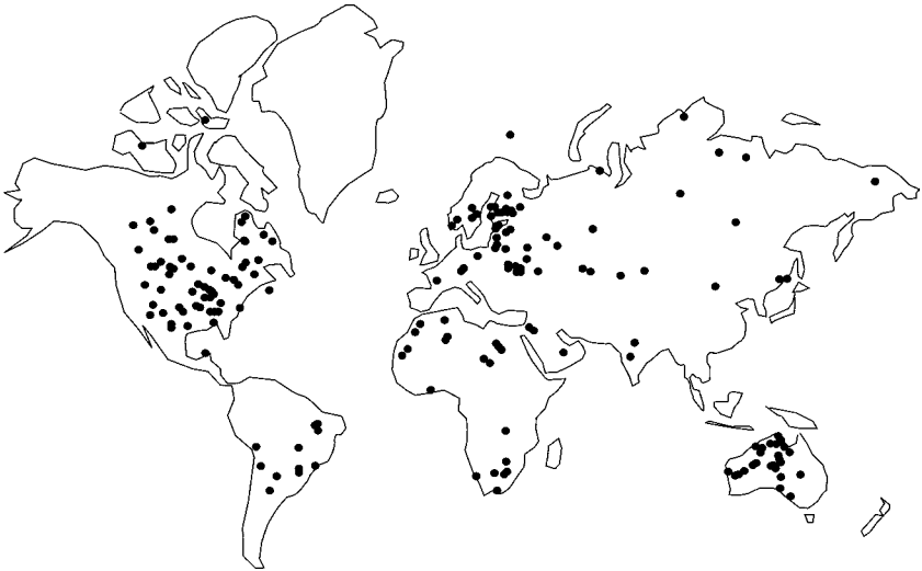
Joonis 6. Meteoriidikraatrite globaalne jaotus.

võrreldes pooluste ümbrusega soodustab ka meteoorkeha atmosfääris viibimise aeg, mis ekliptikatasapinnalt saabuva meteoori puhul on ekvaatoril lühem kui pooluste läheduses. Meenutagem, et mida lühem on teekond läbi atmosfääri, seda suurem on võimalus, et meteoorkeha jõuab maapinnale kraatrit tekitama.